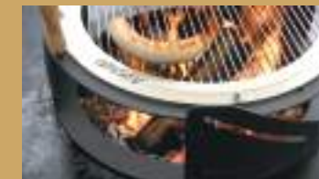
Grillen auf offenem Feuer