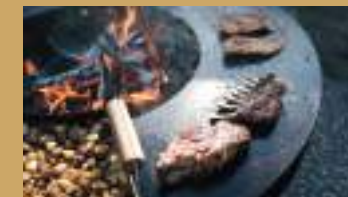
Grillieren auf dem Stahling